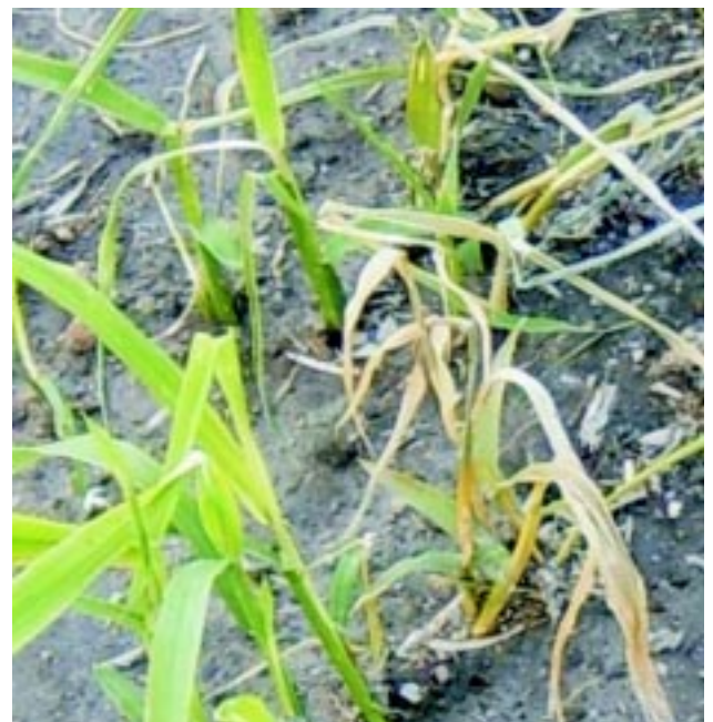
Figura 1 - Plantas de arroz sanas y plantas dañadas en el surco

A finales de octubre un productor y técnico asesor de empresas agrícolas en el departamento de Cerro Largo, consultó a INIA por ataque de los mismos cascarudos en un cultivo de trigo, en la zona de Cuchilla del Paraíso, al sur este del departamento. El trigo estaba en grano pasta y el daño era similar al que se describe en las plantas de arroz maduras; la porción inferior del tallo desfleada o incluso cortada, plantas secas, grano chuzo o a medio secar por la interrupción de la traslocación y plantas volcadas. Escarbando apenas en la base de las plantas se podían encontrar los cascarudos.