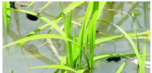
Figura 5 - Cascarudos intentando escapar a la inundación del cultivo

En respuesta a las inquietudes planteadas por productores y técnicos del sector INIA incluyó dentro de sus proyectos de investigación 2007-2011 el estudio de este problema. En primer lugar se relevará la incidencia del cascarudo negro sobre el cultivo de arroz en la zona Este, estudiando la biología del insecto y realizando seguimiento de poblaciones. Para ello se planificaron muestreos mensuales en pasturas, barbechos y otros cultivos en las zonas arroceras, colocación de trampas de luz para registrar fluctuaciones estacionales en vuelos de adultos, revisión bibliográfica, y consulta con especialistas de otros países. También se instalaron en la Unidad Experimental de INIA Treinta y Tres, ensayos de evaluación de insecticidas curasemillas para proteger al cultivo en la etapa de emergencia. Se pretende aportar información que permita la elaboración de recomendaciones para el manejo de la plaga, con el fin de reducir sus daños.