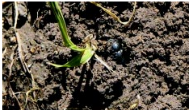
Figura 3 - Planta dañada y cascarudo semienterrado

ciones directas del problema e intercambiar información y opiniones con investigadores de INIA. Durante la gira se vieron daños de diversa magnitud y se encontraron cascarudos semi enterrados en la base de las plantas (Fig. 3).