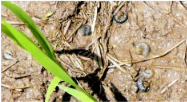
Figura 4 - Larvas muertas en cultivo de arroz

ciones de insectos como nuevos cultivos introducidos en una región y cambios en prácticas de manejo, lo que puede incidir en el desarrollo de una especie de insecto en particular o perjudicar a los agentes naturales de control.