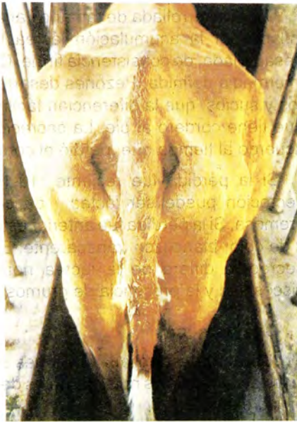
Condición corporal 2.

En las siguientes figuras se muestran las categorías 2 a 6 de estado corporal por apreciación visual, por considerarse las más relevantes para el manejo del rodeo de cría.