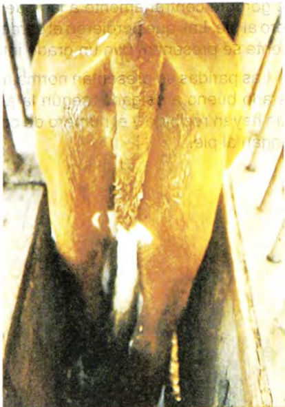
Condición corporal 4.