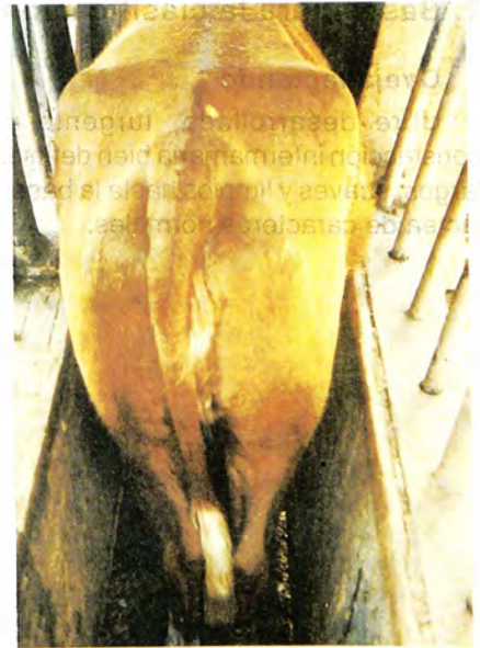
Condición corporal 5.