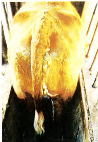
Condición corporal 6.