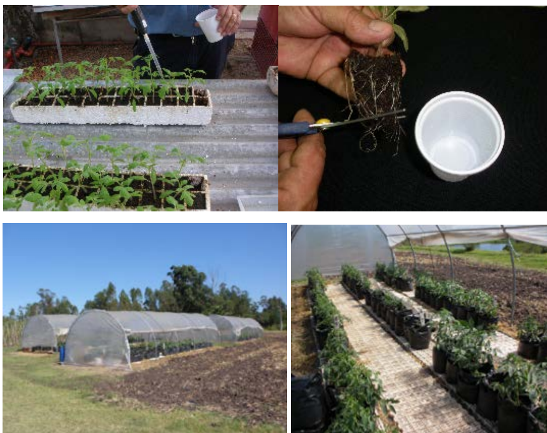
Figura 1. Arriba izquierda: aplicación de los tratamientos en almácigo, derecha: inoculación al trasplante mediante corte de raíces e inmersión en solución bacteriana. Abajo izquierda: vista general de experimento en macrotúneles, derecha: vista de parcelas.

Todas las plantas que sobrevivieron al fin de los experimentos fueron analizadas por la prueba DAS ELISA al fin de verificar la infección con Cmm (reactivos AGDIA Inc. Elkhart, IN, EEUU).