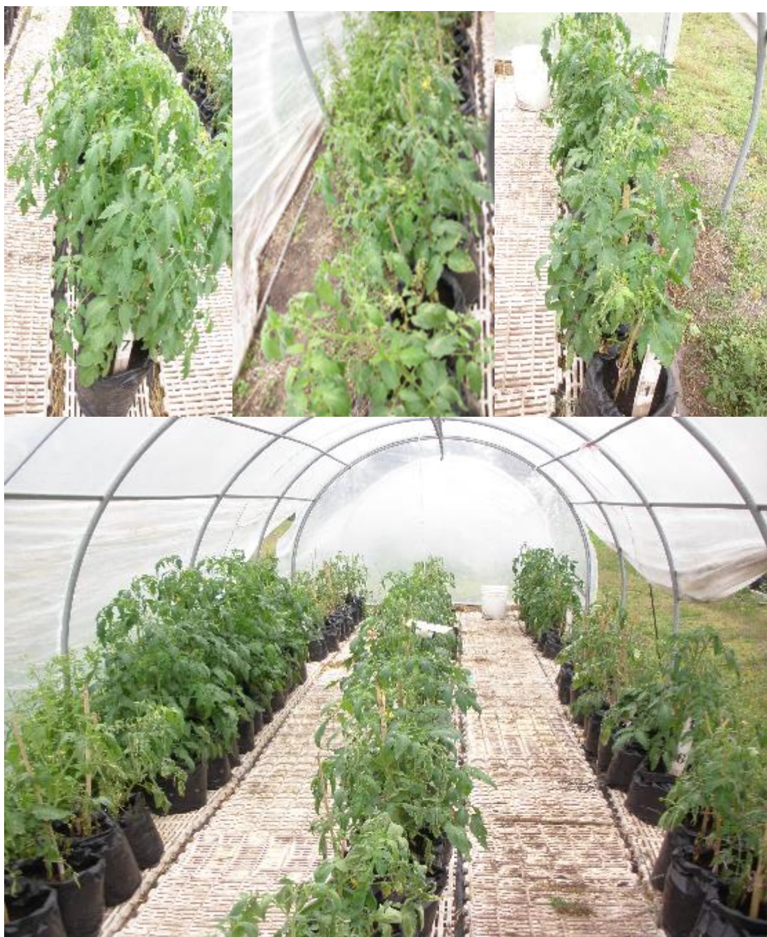
Figura 5. Arriba: izquierda vista de parcela testigo sin tratar, 34 dpi, centro parcela tratada con Biorend, derecha parcela tratada con Bio D. Abajo: vista general de una repetición del experimento.