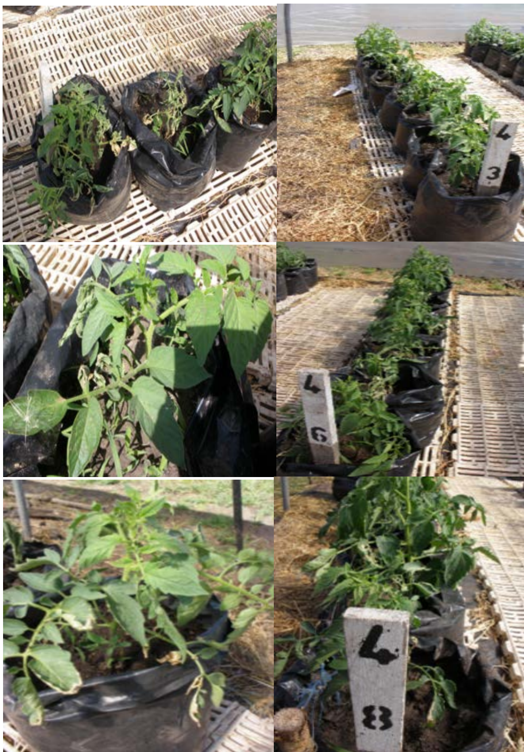
Figura 3. Columna izquierda: plantas con síntomas de cancro bacteriano en experimento 1. Columna derecha: fila superior parcela tratada con Nacillus, centro parcela tratada con Biorend e inferior parcela tratada con sulfato de cobre.