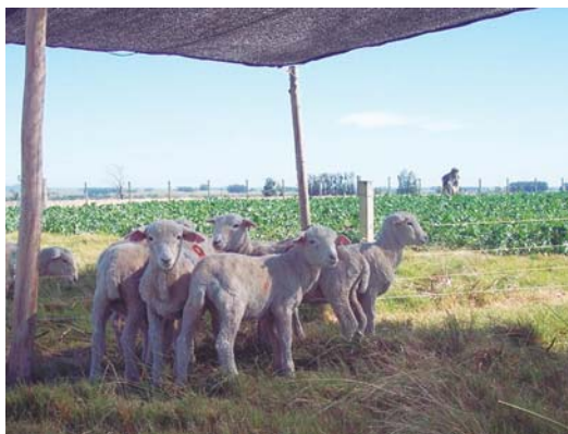
Figura 2. Animales con acceso a sombra artificial descansando en horas del mediodía.

esquila. En otros casos se ha encontrado respuesta positiva en el corto plazo (2 meses) para animales esquilados, aunque no se han detectado efectos a largo plazo en el crecimiento o en la producción de lana (Azzarini, 1983).