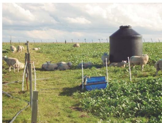
Figura 1. El acceso a agua y sombra ayuda a la reducción del estrés calórico de los animales durante el verano.