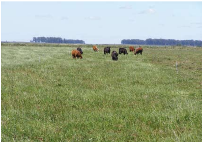
Figura 2. Pastoreo en franjas de pradera de 2º año durante el ensayo.