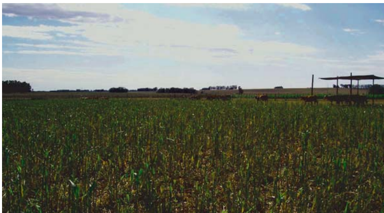
Figura 3. Novillos del tratamiento sombra restringida saliendo a pastorear a las 16.00 horas.

Con respecto a las demás actividades, no se encontraron diferencias significativas entre tratamientos ( P > 0.05 ) en el tiempo que