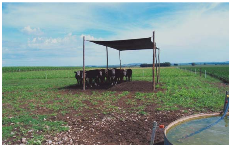
Figura 1. Animales del tratamiento con agua y sombra sin acceso al pastoreo entre las 11.00 y 16.00 horas.

Se registró diariamente la temperatura ambiente y la humedad relativa a intervalos de 1 hora durante las 24 horas a través de dos sensores de uso externo, uno ubicado al sol y otro debajo de la sombra. En base a las lecturas se calculó un Índice de Temperatura-Humedad (ITH) descrito por Wiersama (2005) y utilizado como indicador de estrés térmico en ganado lechero (Cuadro 1). La fórmula de cálculo fue ITH = (0.8 * temperatura) + (humedad\ relativa/100) * (temperatura - 14.4) + 46.4 .