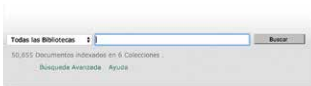
Figura 3 - Catálogo. Caja de búsqueda, opción búsqueda simple

En el caso de contenidos que por derechos de autor o editorial no es posible descargar a texto completo se ofrece el contacto de la biblioteca que contiene el documento para que el usuario se comunique y se pueda acordar una forma de brindarle la información.