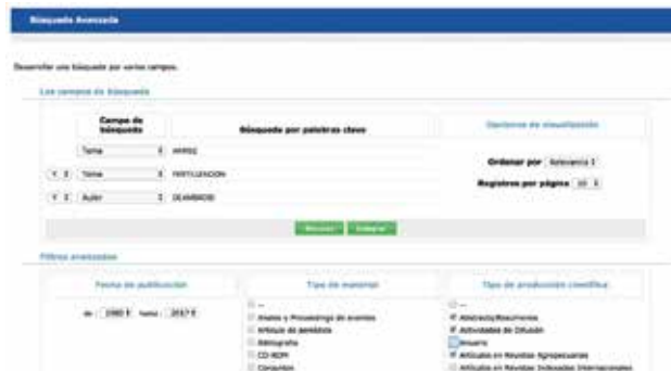
Figura 4 - Catálogo. Caja de búsqueda avanzada con opciones de filtros.