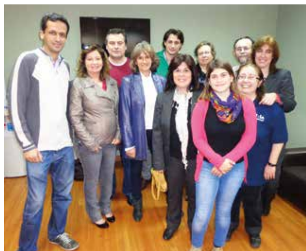
Figura 5 - Integrantes de parte del equipo de trabajo EMBRAPA-INIA.