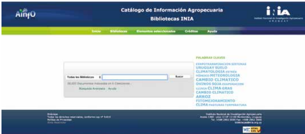
Figura 1 - Pantalla inicio, búsqueda simple.

humanos y transferencia de tecnología para apoyar la organización del acervo documental y la información tecnológica en INIA Uruguay”) para la transferencia del sistema AINFO a INIA Uruguay así como la transferencia de know-how de EMBRAPA en relación con el referido software. Como contrapartida INIA participó en la traducción y validación de los comandos y funcionalidades del sistema AINFO al español de modo de ampliar el espectro de aplicación y llegar a los usuarios de los países de habla hispana.