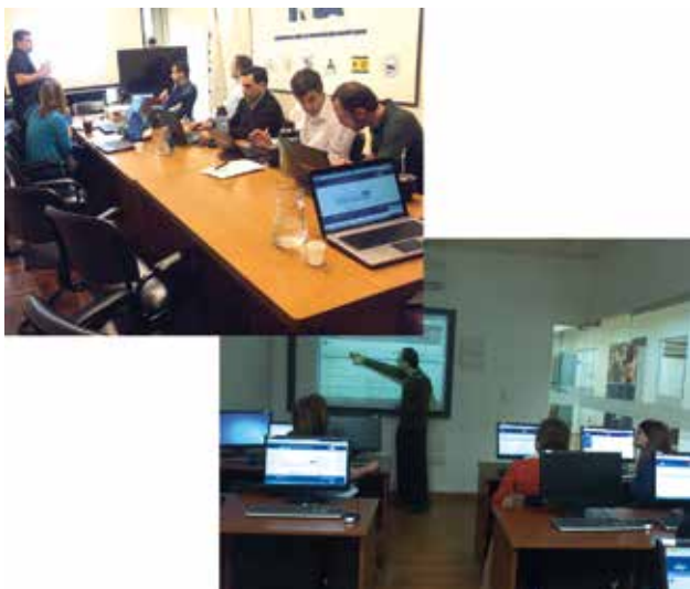
Figura 2 - Equipo técnico EMBRAPA-INIA.

Este proyecto enmarcado en la cooperación técnica internacional entre ambas instituciones, ha sido el comienzo de trabajos compartidos por lo cual es de gran importancia para la promoción de intercambio de conocimiento y experiencias interinstitucionales en materia de gestión documental, el fortalecimiento, normalización y difusión de información técnica y científica de las Bibliotecas INIA en su proceso de automatización.