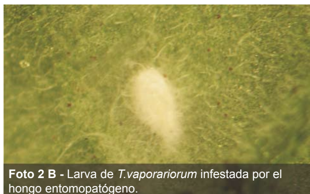
Foto 2 B - Larva de T. vaporariorum infestada por el hongo entomopatógeno.

control de “mosca blanca”. Las evaluaciones se realizaron en cultivos de tomate en predios del departamento de Canelones, bajo Producción Integrada (PI) 3 y Producción Orgánica (PO) 4 , y en distintos ciclos de cultivo: primavera-verano y otoño-invierno.