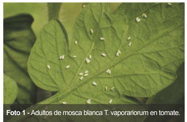
Foto 1 - Adultos de mosca blanca T. vaporariorum en tomate.

Habitualmente en Uruguay, el control de esta plaga se basa en el empleo de insecticidas químicos.