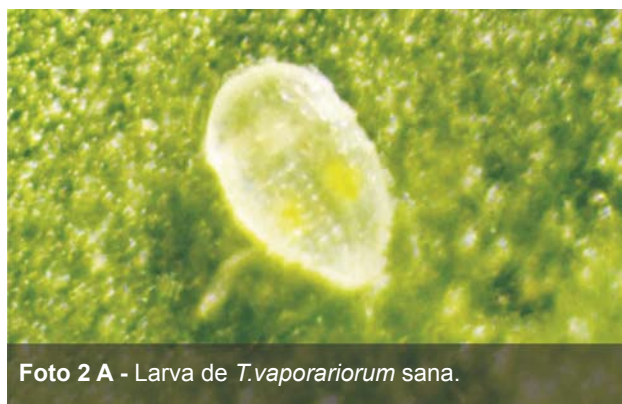
Foto 2 A - Larva de T. vaporariorum sana.

Durante el período octubre 2005 - setiembre 2006, se evaluó un bioinsecticida en base al hongo L. lecanii elaborado en las instalaciones de LAGE y Cia., para el