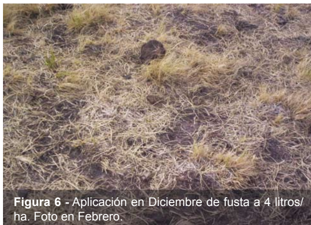
Figura 6 - Aplicación en Diciembre de fusta a 4 litros/ha. Foto en Febrero.