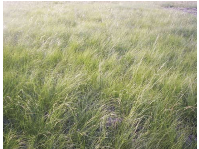
Figura 3 - Estado de capin en Octubre.

El objetivo planteado fue estudiar la dosis necesaria para controlar al capin independientemente de su estado fenológico, con lo cual durante un período de un año se hicieron aplicaciones mensuales.