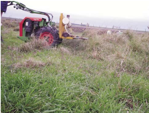
Figura 2 - Control de capin annoni con máquina de sogas, Artigas, Ruta 30, km 49.

En infestaciones altas la llegada del producto a las sogas puede limitar el mojado de las plantas.