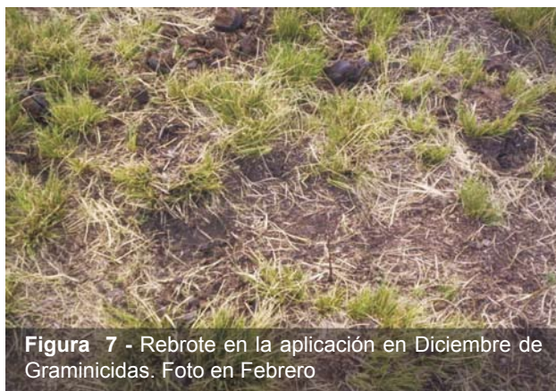
Figura 7 - Rebrote en la aplicación en Diciembre de Graminicidas. Foto en Febrero