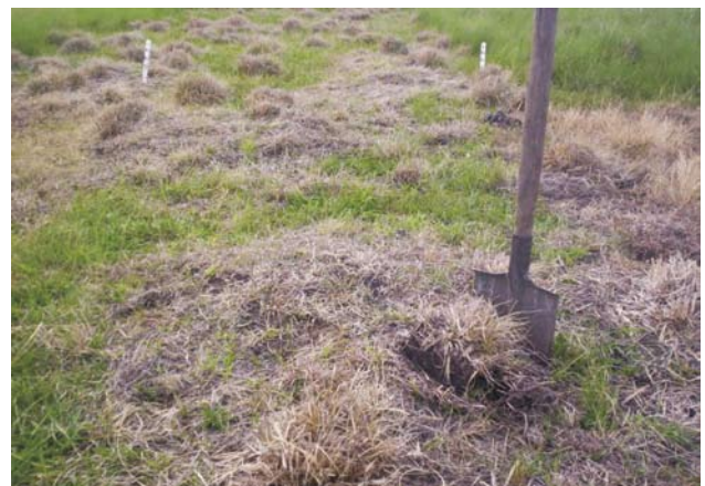
Figura 4 - Aplicación en Octubre de roundup full II a 2 L/ha. Foto en Diciembre.

Los resultados de control a esas tres dosis fueron excelentes, no obstante las altas temperaturas (25 a 32°C) y los bajos porcentajes de humedad (35 a 45%) que se registraron en los distintos meses al momento de realizar las aplicaciones.