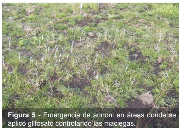
Figura 5 - Emergencia de annoni en áreas donde se aplicó glifosato controlando las maciegas.

La aplicación de glifosato, como ya fue mencionado, es el punto de partida para el manejo integrado de la especie, en tanto las dosis y períodos de barbecho deben ser evaluados para cumplir con los objetivos de promover la germinación de semillas de capin e ir controlando su banco, y para levantar limitantes alelopáticas a las cuales hace referencia la bibliografía.