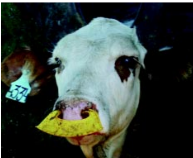
Foto 2 - Aplicación de tablilla nasal