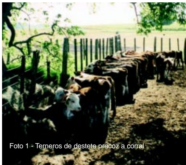
Foto 1 - Terneros de destete precoz a corral

En la Figura 1 se presenta la ovulación acumulada después de un destete precoz (resultados de 3 años de trabajos experimentales) en vacas de primera cría con una condición corporal al parto promedio de 4.0 unidades y 340 kg de peso vivo. Cabe recordar que la Figura muestra ovulación acumulada y no celo, o sea que teniendo en cuenta las consideraciones antes expuestas, los celos se manifestarían entre 7 y 10 días más tarde.