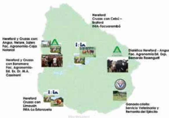
Figura 2 - Localización de Experimentos en Cruzamientos de vacunos de carne en Uruguay.