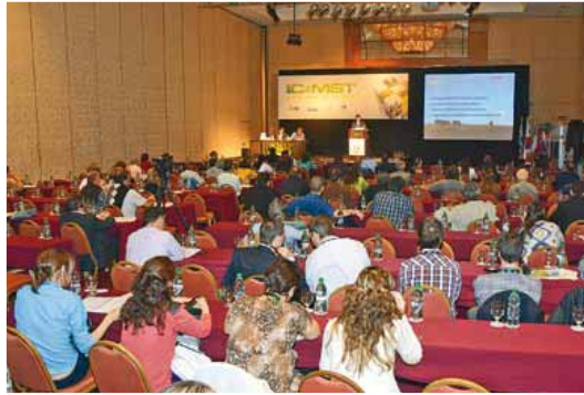
Uruguay se posiciona en una región productora de carne

Al enfocar la situación en cuanto a la sustentabilidad de los sistemas, el especialista marcó algunas prioridades como mejorar la calidad ambiental, minimi-