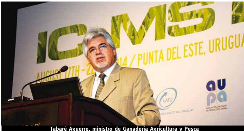
Tabaré Aguerre, ministro de Ganadería Agricultura y Pesca

Explicó que Uruguay paso de ser un país donde la inversión medida en término de Producto Bruto