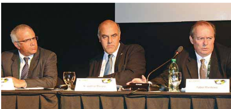
El congreso permitió ver de primera mano a calificados científicos internacionales