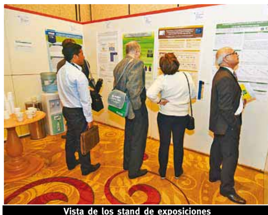
Vista de los stand de exposiciones

La investigación apunta a la relación rendimientos-calidad de producción