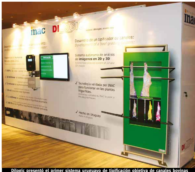
Dilogic presentó el primer sistema uruguayo de tipificación objetiva de canales bovinas

Basado en este logro y con el objetivo de dar un paso más en el continuo mejoramiento de la calidad de las carnes uruguayas, en el año 2012 INAC encargó a Dilogic el estudio de otro desarrollo para su integración al sistema, un equipo autónomo de tipificación objetiva de canales (media res bovina), tarea que hasta el presente es realizada por un operario de forma subjetiva. Se