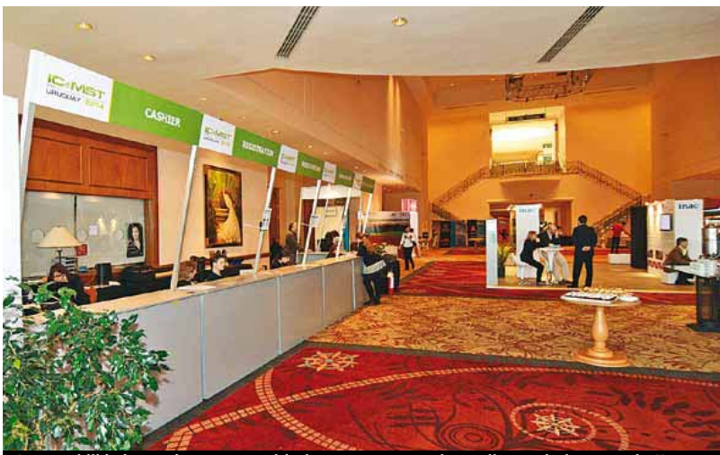
La trazabilidad ganadera es un vehículo para promover los atributos de la carne de Uruguay

Otro elemento asociado al proceso de cómo se genera la carne refiere a la sensibilidad y al deseo de comprar un producto frente a otro que refiere a la producción que debe cumplir con algunas características vinculadas a la naturaleza, por ejemplo la alimentación animal en base a pasto, su cría a cielo abierto, considerando las buenas prácticas en el manejo animal que permitan una buena salud y bienestar de los ganados.