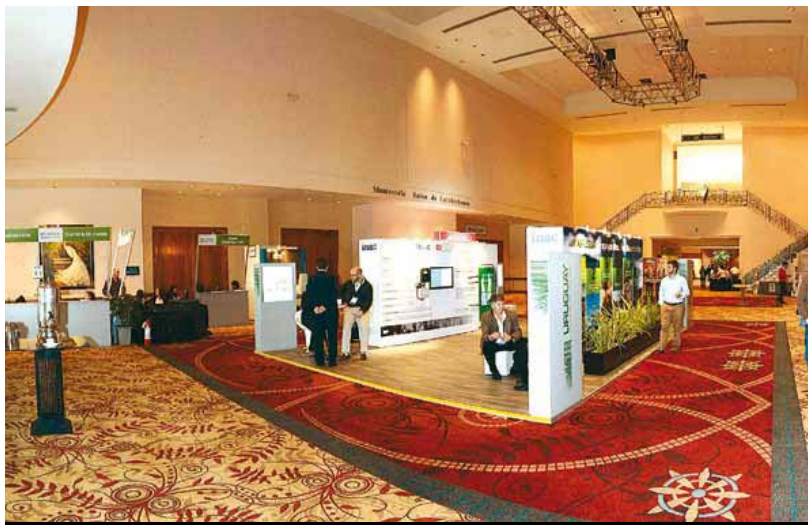
Para del Campo la investigación a nivel nacional ya ha generado un volumen de información

miento científico sobre bienestar animal generada en los países desarrollados y mayoritariamente en condiciones intensivas de producción, es la que en general se utiliza para redactar normas y recomendaciones a nivel internacional. Este tipo de información no es extrapolable a las diferentes realidades y es por eso que “hicimos especial hincapié en ese aspecto, destacando algunas exigencias recientes de la Unión Europea (UE) y recomendaciones de la Organización