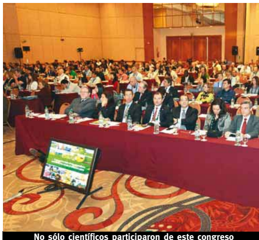
No sólo científicos participaron de este congreso

rida a ciencia y tecnología de la carne, “tenemos gente que ha estudiado y desarrollado inteligencia; mi ilusión es que Uruguay sea una referencia en materia de intelectualidad respecto a la carne, no solo en producción sino que también en toda la tec-