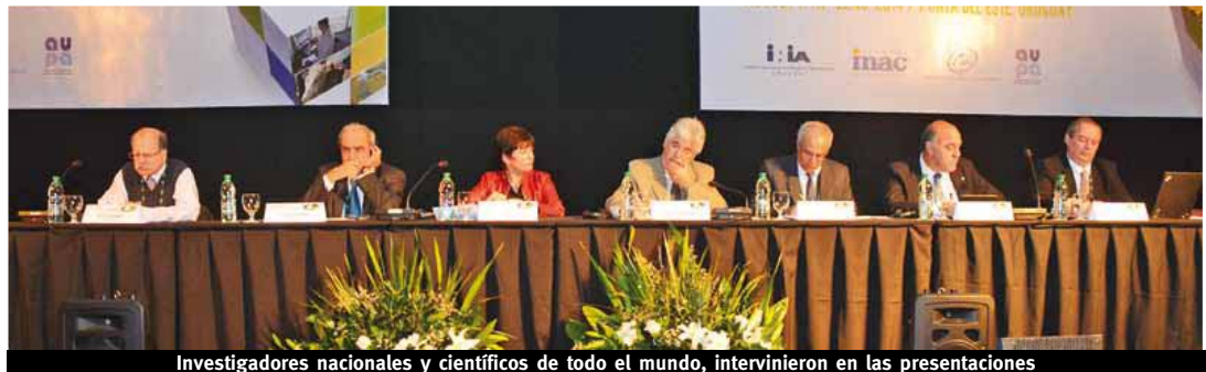
Investigadores nacionales y científicos de todo el mundo, intervinieron en las presentaciones

En todos esos temas el congreso alcanzó características de muy buen nivel, especialmente algunos como carne y sustentabilidad, en la presentación de la