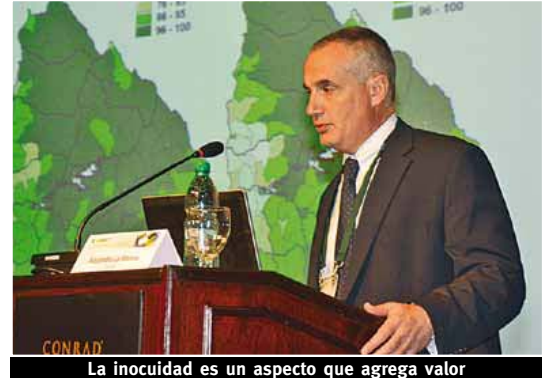
La inocuidad es un aspecto que agrega valor

Los sistemas de engorde a corral son sin hormonas, las cuales están prohibidas en Uruguay, con entre 90 y 100 días de granos, escasos corrales y un buen vínculo de