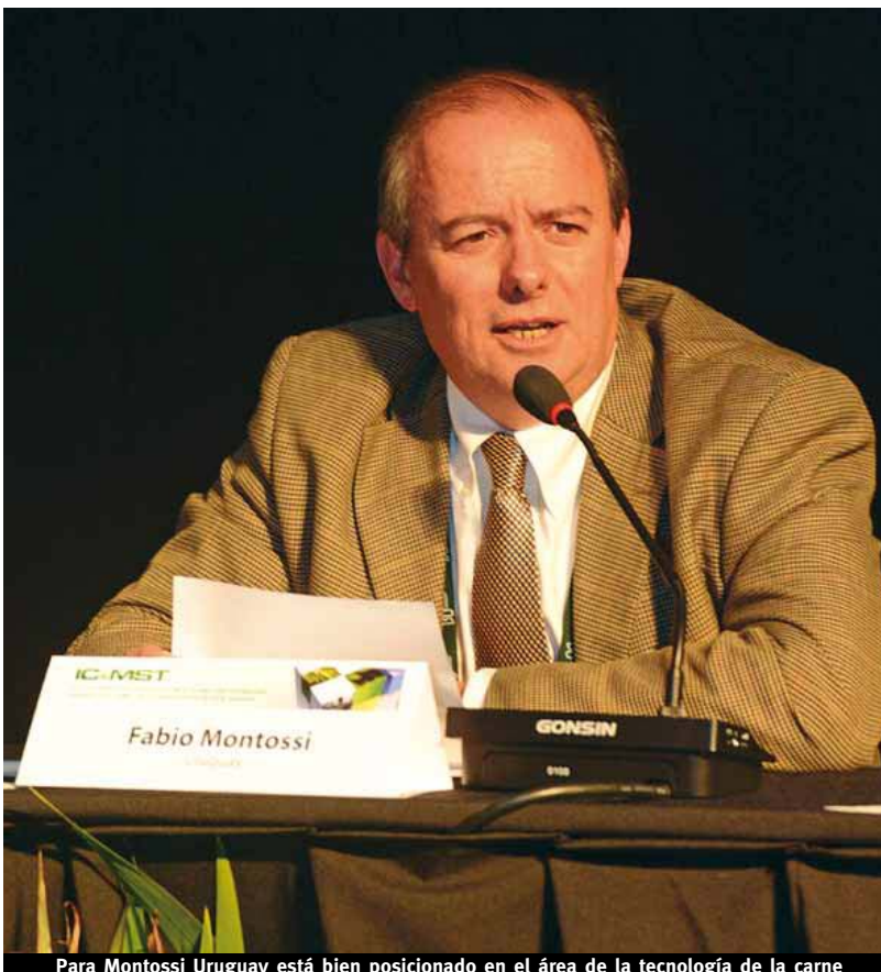
Para Montossi Uruguay está bien posicionado en el área de la tecnología de la carne

Según Montossi, no cabe ninguna duda de que el producto debe ser inocuo y que debe tener un alto valor nutricional para poder alimentar en forma beneficiosa a un ser humano. Este aspecto se trató de difundir en el Congreso a través de la investigación nacional.