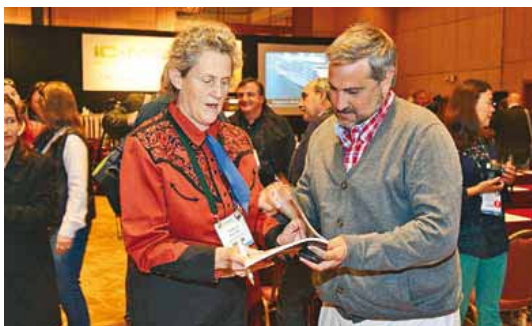
A la izquierda, Temple Grandin, especialista de Estados Unidos

Conferencistas de 15 países dieron su visión en el congreso