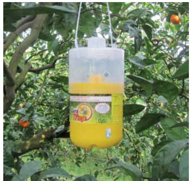
Figura 4 - Trampa Ceratrap