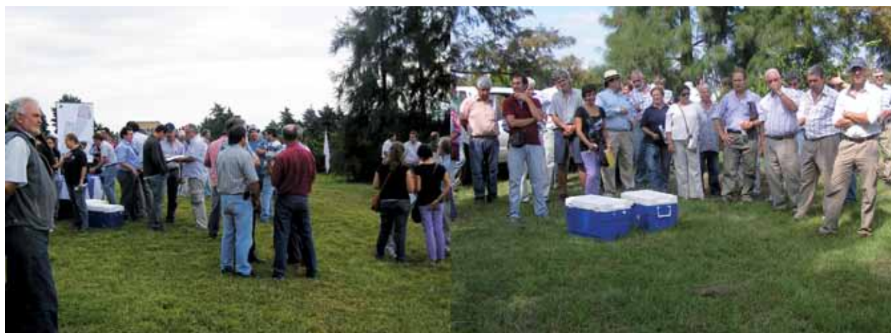
Figura 5 - Jornadas de campo sobre experimentos en predios de producción.

Ceratrapp. Trampa líquida. Es un recipiente de plástico (0,6 litros) que contiene un atrayente líquido basado en un formulado proteico. De acuerdo a los fabricantes la trampa tiene una emisión continua y controlada de compuestos volátiles, de elevado poder atrayente para los adultos de la plaga Ceratitis capitata , mayoritariamente para las hembras. Una vez las moscas entran en el mosquero mueren por ahogamiento en el líquido.