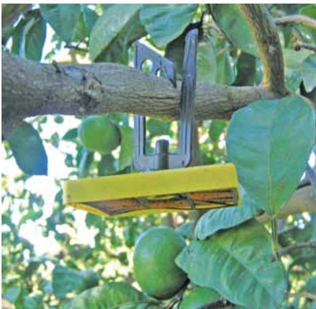
Figura 3 - Trampa M3.