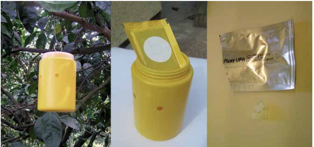
Figura 2 - Trampa Susbin, sobre TRI-PACK y pastillas de vapona.

M3. Trampa seca. Contiene atrayentes y Alfa cipermetrina e Imidacloprid como insecticidas. Las moscas mueren al tomar contacto con el producto.