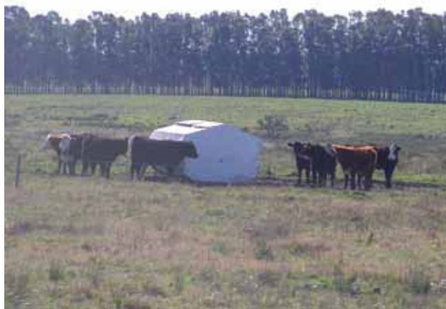
Figura 5 - Suplementación utilizando comederos de autoconsumo.

y mano de obra. A ello se le debe agregar la ventaja de algunos productos comerciales que ya incluyen micro y macrominerales en la formulación de las raciones, en sus diferentes formas de presentación (bloques, pellets y concentrados).