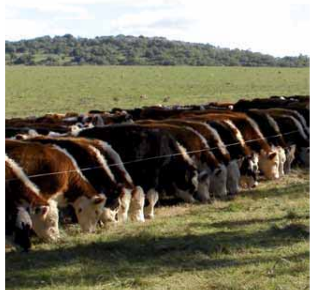
Figura 4 - Lote de animales suplementados con ensilaje de grano húmedo de sorgo

Por último, se encuentran disponibles en el mercado suplementos balanceados. Una de las principales fortalezas de las raciones balanceadas es que algunas de ellas son elaboradas para su utilización en comederos de autoconsumo, con el consecuente ahorro de tiempo