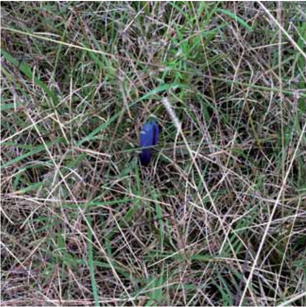
Figura 3 - Condición de un CN de Lomadas del Este

les. En cambio, en un potrero con disponibilidad media de pastura (Figura 3) se puede utilizar un suplemento energético-proteico (ej. grano húmedo de sorgo + núcleo proteico o afrechillo de arroz) que permita obtener ganancias moderadas (200-400 gramos/animal/día) inclusive favoreciendo una mejor utilización del forraje.