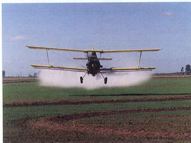
Herbicida post emergencia temprana