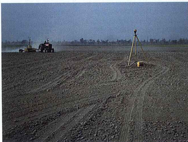
Preparación y nivelación de suelos