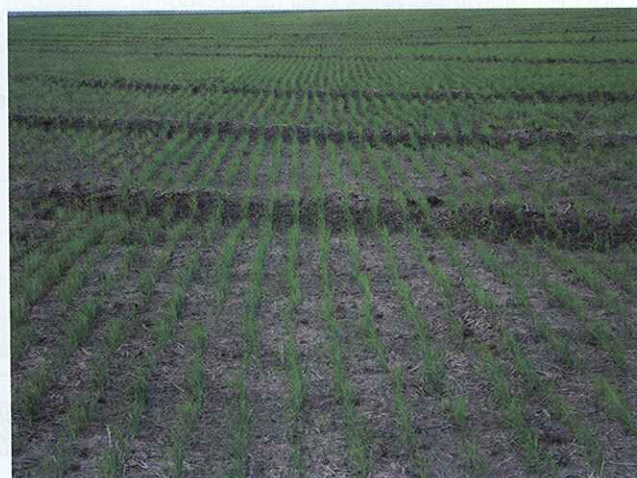
Taipas anticipadas a la siembra