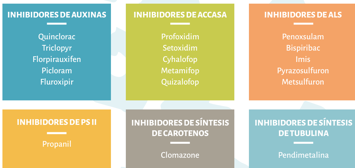
◀ Figura 2 Modos de acción de los principales herbicidas usados en arroz en Uruguay.

matriz podría servir de guía a los productores para que puedan evaluar si lo que están aplicando en sus sistemas de producción tiene mayor o menor riesgo, desde el punto de vista de la aparición de resistencia en malezas.