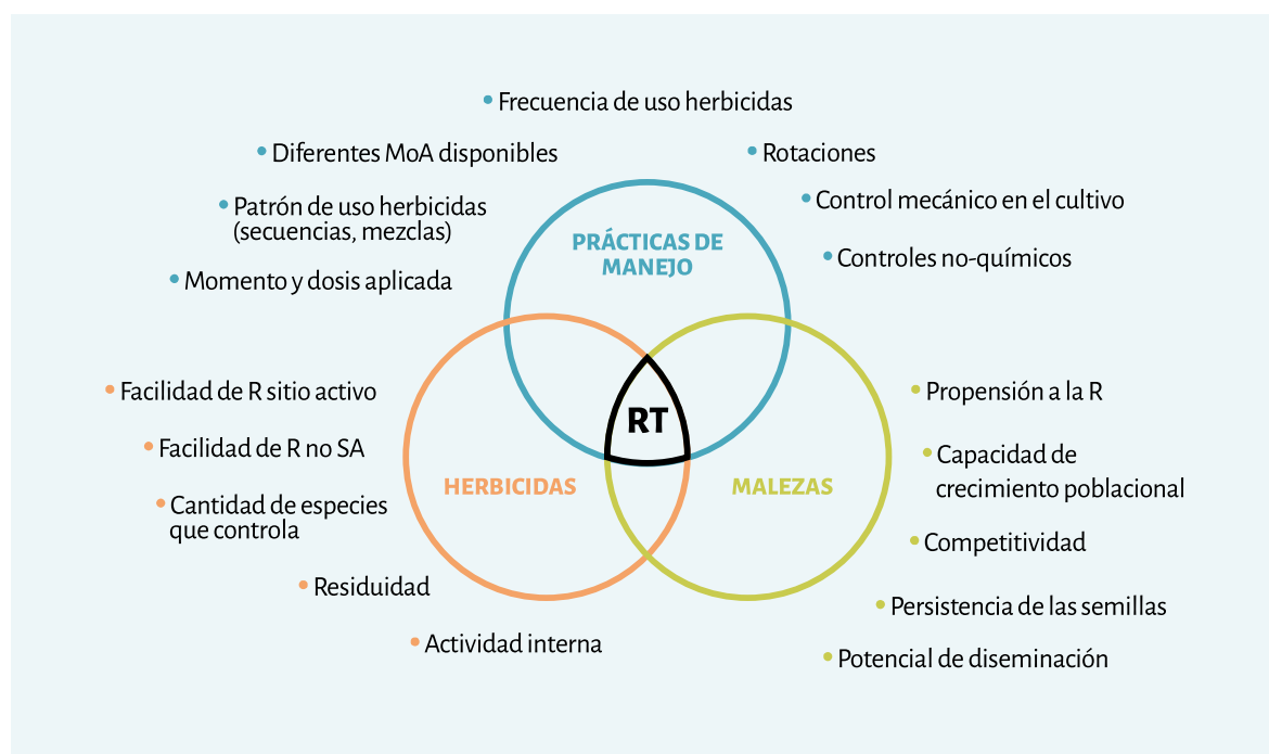
◀ Figura 3 Principales factores de riesgo para la evolución de resistencia, y sus componentes; RT: riesgo total; MoA: modo de acción; R: resistencia; SA: sitio activo. (Adaptado de Moss, 2018).

de resistencia es común en algunos modos de acción, ya que existen varias mutaciones que le pueden dar resistencia, haciendo relativamente fácil la selección de resistencia. Por ejemplo, los inhibidores de la ALS y los de la ACCasa (graminícidas). La existencia de tantas posibles mutaciones hace que la resistencia a estos herbicidas sea abundante y rápida de seleccionar. Dentro de los mecanismos no de sitio activo, el más conocido es la resistencia metabólica, donde el herbicida es desactivado dentro de la planta por debajo de la concentración letal antes de llegar al sitio de acción. También hay malezas que logran impedir la absorción o translocación del herbicida, y el secuestro de este, aislándolo en una vacuola.