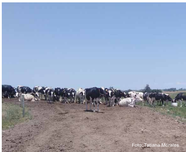
Figura 4 - Animales en el camino al tambo robotizado.

Otro hallazgo fue que el tiempo en las pasturas y en “otros” (caminos y tambo) se relacionó con el ITH. Las vacas pasaron menos tiempo en las pasturas (1 % menos) al aumentar el ITH; mientras que permanecían en los caminos y/o infraestructura del tambo (1 % más por cada aumento de ITH) (Figura 4).