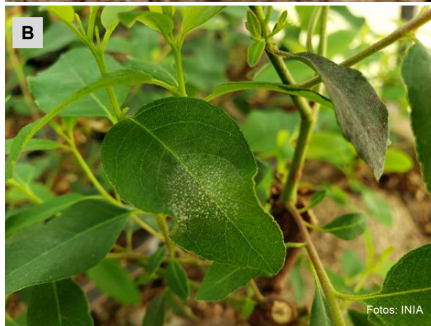
Figura 4 - Plantines de Eucalyptus con daño por ácaros (A) y oídio (B).