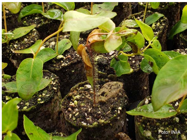
Figura 3 - Plantín de Eucalyptus con pudrición de tallo por Botrytis .

trataba en la mayoría de los casos de daños puntuales, restringidos a una o muy pocas bandejas en un área del vivero. Si bien se detectaron síntomas de la avispa de la agalla y de psílicos, su frecuencia fue mucho menor de lo esperado, tratándose en la totalidad de los casos de situaciones marginales.