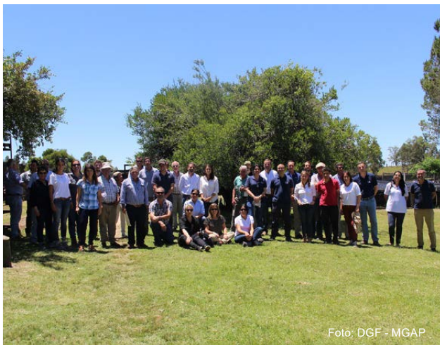
Figura 2 - Asistentes a la jornada de viveros 2019, vivero Cerros del Olimar.

La pandemia de COVID 19 impidió que en 2020 se realizara una jornada presencial, por lo que se consideró la posibilidad de hacerla virtual. Una vez confirmado el interés de los viveristas en participar en esa modalidad se organizó y llevó a cabo en noviembre, con el apoyo de la Unidad de Comunicación y Transferencia de Tecnología de INIA y con exposiciones destacadas de técnicos de INASE y Facultad de Ciencias (Udelar). En síntesis, el camino recorrido durante estos años ha permitido contar con una participación creciente en sucesivas ediciones. Las jornadas se han perfilado como un espacio privilegiado de intercambio entre actores que evidencia, además, la fuerte interacción entre el sector público, el sector privado y la investigación.