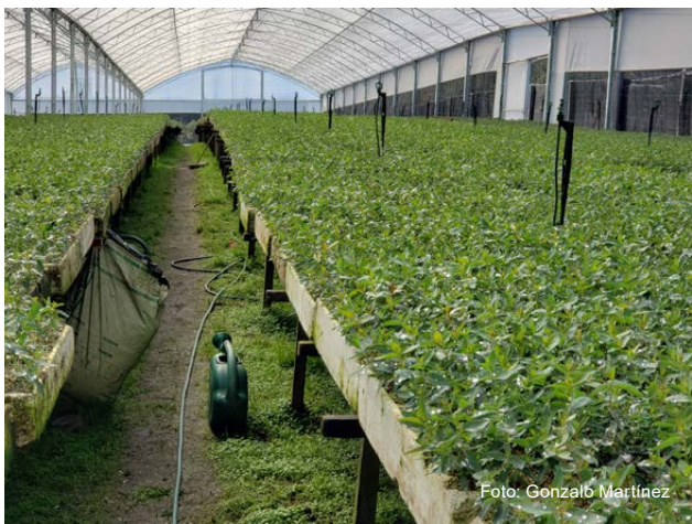
Figura 1 - Vivero Forestal CyS, Rivera.