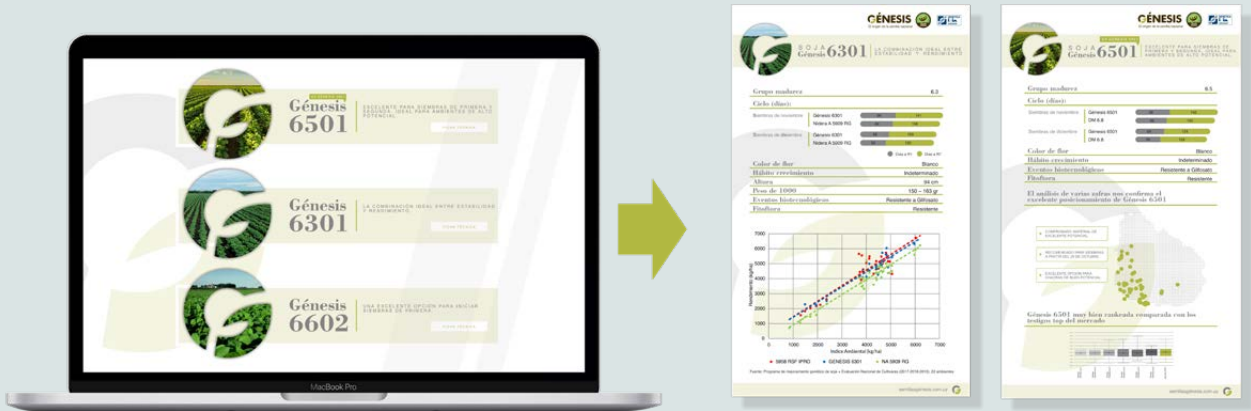
Figura 1 - Descarga de fichas técnicas de soja.