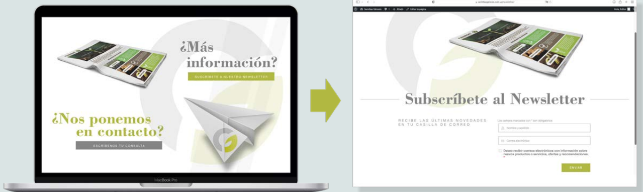
Figura 2 - Suscripción a Newsletter Génesis.