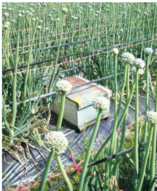
Figura 3 - Colonia de abejas A. mellifera en cultivo de cebolla ( Allium cepa ).

En el Cuadro 1 se puede ver una relación de dependencia de diferentes cultivos donde: el valor 1- significa que ese cultivo depende 100% de la presencia de insectos para producir sus frutas y semillas y el valor 0- significa que ese cultivo no depende de la polinización entomófila para producir en todo su potencial (cuadro 1).