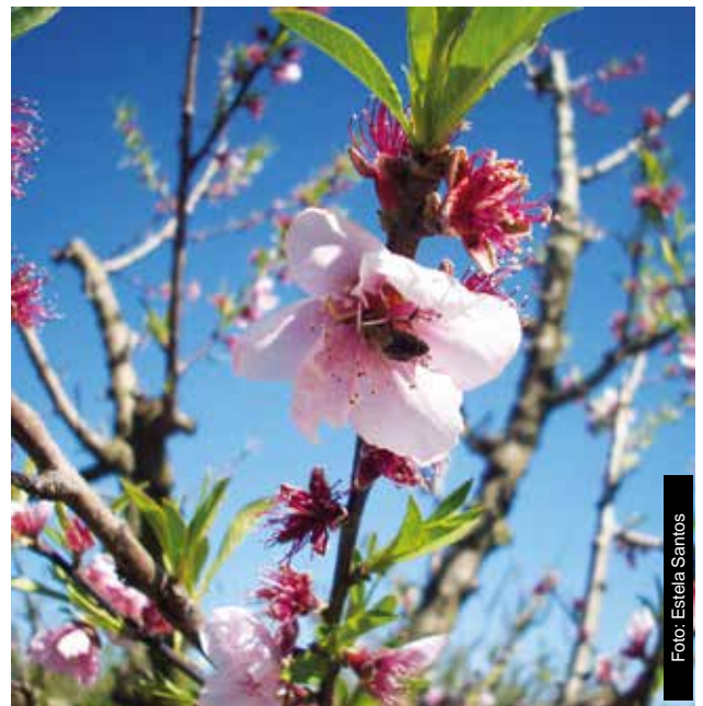
Figura 4 - Abeja A. mellifera polinizando el durazno ( Prunus persica ).

Los polinizadores son considerados claves en los ecosistemas, ya que son esenciales para la producción de frutas y semillas y son responsables indirectamente del mantenimiento de las especies y comunidades vegetales.