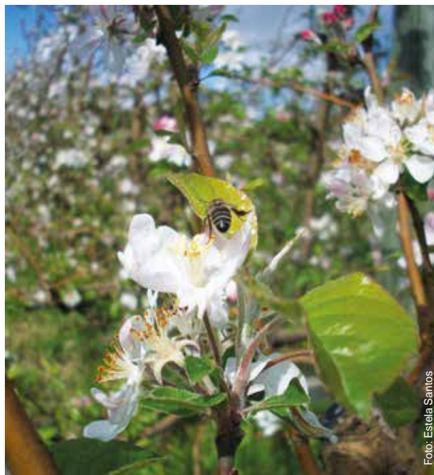
Figura 2 - Abeja A. mellifera polinizando el manzano ( Malus domestica ).

Pero la abeja melífera Apis mellifera , es el principal insecto polinizador que podemos manejar de forma artificial para cubrir los diferentes requerimientos que las flores poseen, por ello el trabajo entre productores de