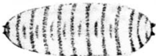
Figura 2. Pupa de Melanagromyza minimoides (Valladares et al. , 1982).

Los adultos comienzan a ser vistos sobre los capítulos apenas abren las brácteas del botón floral, las hembras