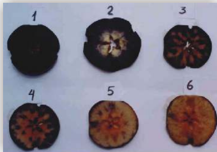
Figura 1.- Test de Yodo. Grado de madurez de manzanas rojas, referida a la reacción almidón – yodo, en una escala del 1 – 6.