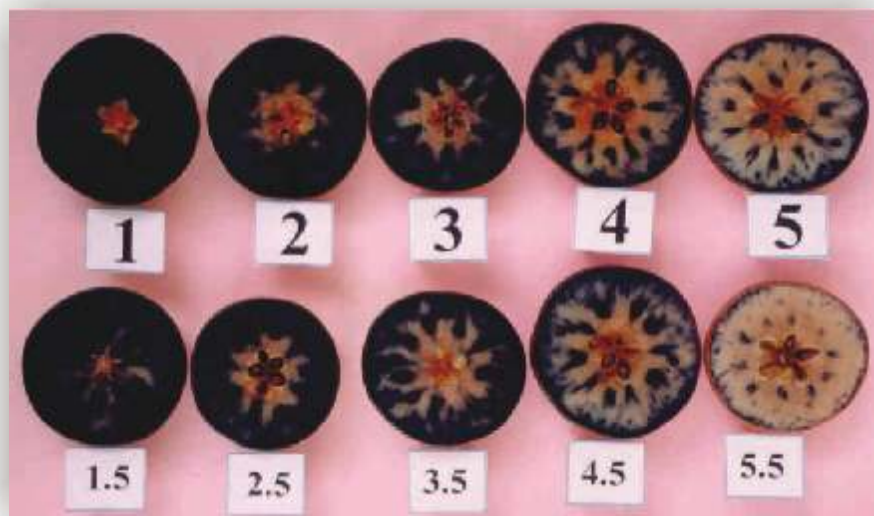
Figura 2.- Test de Yodo. Grado de madurez de manzana Royal Gala, referida a la reacción almidón – yodo, en una escala del 1 – 5.5