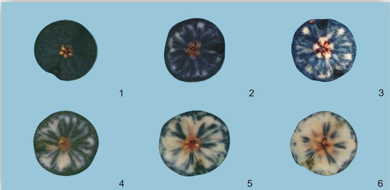
Figura 4.- Test de Yodo. Grado de madurez de manzana Cripps Pink – Pink Lady™, referida a la reacción almidón – yodo, en una escala del 1 – 6