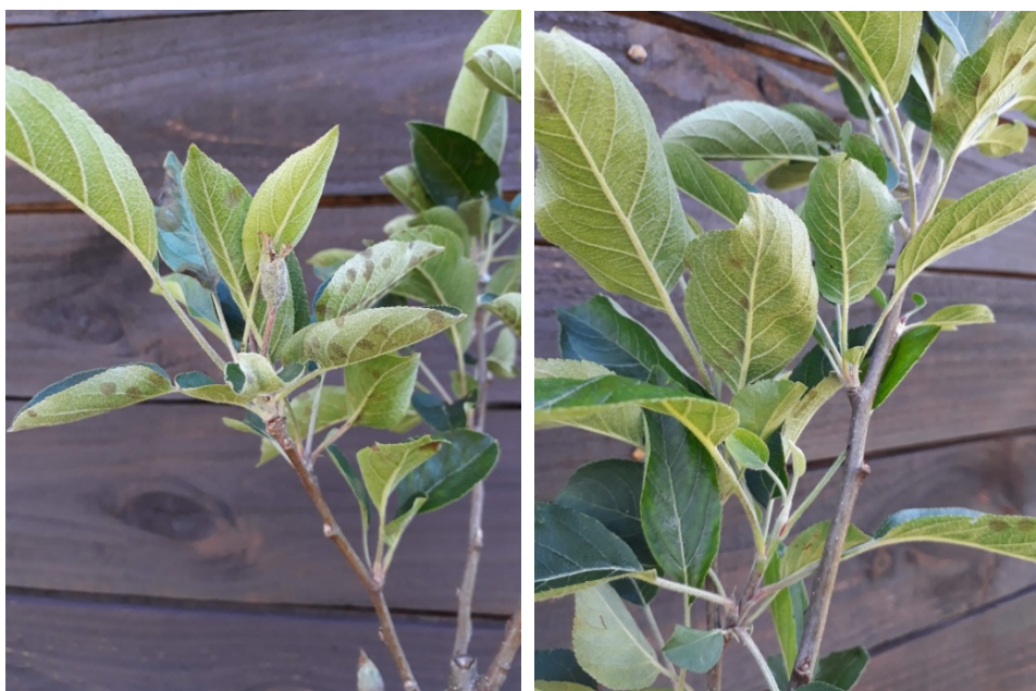
Figura 2. Síntomas de Venturia inaequalis observados en plantas de manzano variedad Oregon Spur sin tratamiento con fungicida pos-infección (izquierda) y tratadas con dodine pos-infección (derecha)

La comprobación de la existencia de resistencia de las poblaciones de V. inaequalis a dodine aumenta las dificultades existentes para manejar esta enfermedad. Antes de este trabajo se tenía la expectativa de que el uso pos-infección del dodine contribuiría a minimizar las aplicaciones de fungicidas IBEs para los cuales ya se había constatado resistencia. Los resultados obtenidos obligan a minimizar, y en lo posible evitar, la necesidad de realizar aplicaciones curativas para el control de V. inaequalis . La manera de lograr esto es siguiendo una estrategia preventiva lo más eficiente posible de modo de que los árboles lleguen a cada período de infección protegidos por aplicaciones recientes de fungicidas de contacto. Para ello el pronóstico meteorológico constituye una herramienta indispensable para el manejo de esta enfermedad.