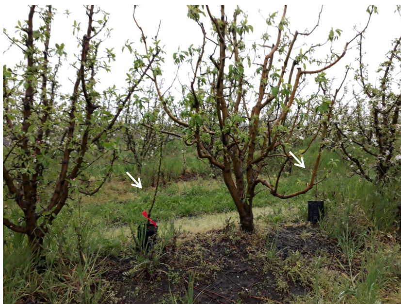
Figura 1. Plantas de manzano variedad Oregon Spur (flecha blanca), mantenidas en un monte que presentó 30% de aislados resistentes in vitro , durante uno de los eventos de infección de Venturia inaequalis

Aproximadamente a los 15 días del primer evento de infección se observaron los primeros síntomas mientras que la evaluación del ensayo se realizó 15 días después de ocurrido el segundo evento de infección. Los resultados se muestran en el cuadro 2.