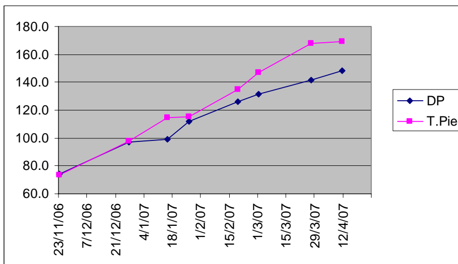
Figura 3. Terneros de vacas de primera cría

La evolución de peso de los terneros destetados precozmente y de los criados al pie de la madre se presenta en la figura 3.