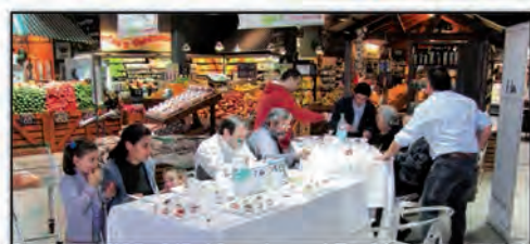
¿Cómo sería su frutilla ideal?

Durante varios años realizamos pruebas de degustación de frutillas en diferentes supermercados en el norte y sur de Uruguay. Los consumidores probaban entre 5 y 6 variedades diferentes y luego contestaban cuánto les gusta (escala 0 a 9) y marcaban características de cada muestra mediante la aplicación de una metodología conocida como CATA (“check all that apply” o “marque todo lo que corresponda”). El análisis de estos resultados nos muestra las variedades más aceptadas por los consumidores, así como también su clasificación como dulces, ácidas, con más o menos sabor u aroma típico a frutilla, jugosa, blanda o firme, entre otros (Figura 1) (Lado et al. , 2012, 2010). En estos estudios también comprobamos que el sabor de las fru-