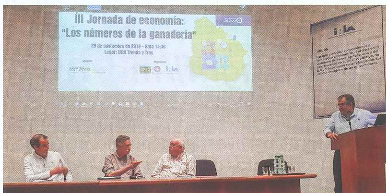
Productores, consignatarios, industriales, representantes del Estado, la investigación y la transferencia se reunieron en Treinta y Tres

"Una de las cosas que percibimos es que hay un importante número de productores, sobre todo en los extractos más chicos, que tiene sistemas productivos con una utilización de tecnología muy básica, muy primaria, en casi