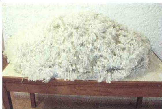
Foto 1. Primer vellón producido (13.8 micras) por el borrego INIA Glencoe 5389 del NMF

·Se dispone de un cúmulo muy importante de información tecnológica del efecto de diferentes factores (alimentación, manejo sanitario y reproductivo, interacción genotipo-ambiente) sobre la reproducción, producción y calidad de lana, que demuestra la factibilidad de incorporar la producción de lanas finas y superfinas en sistemas productivos extensivos como una alternativa de mejorar la productividad e ingreso de los productores de la región de Basalto, e